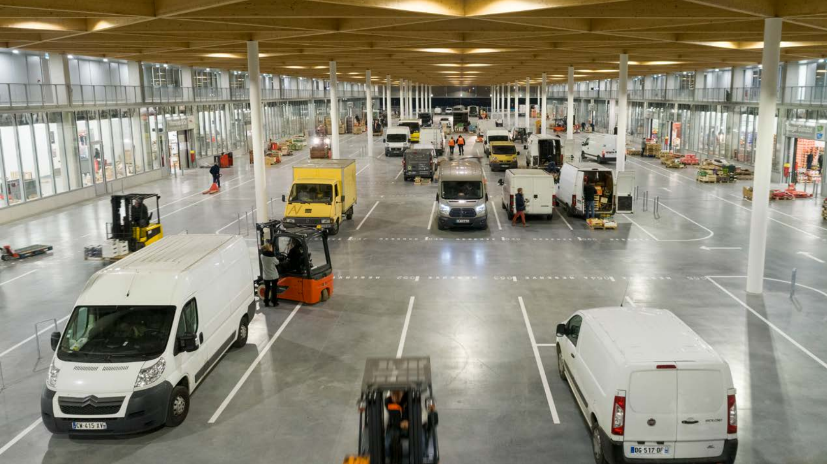
La grande halle du bâtiment A, dédiée aux fruits et légumes.